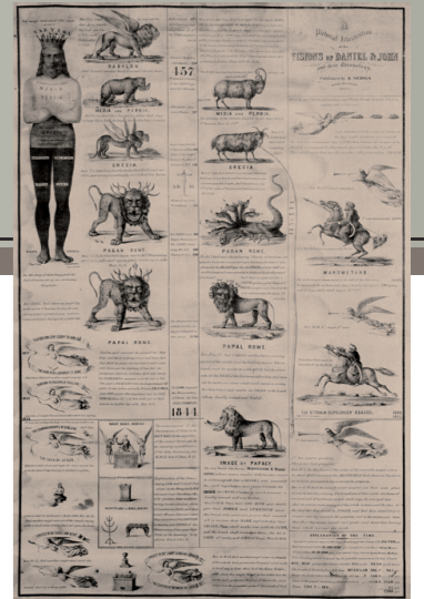
Die Zeitprophezeiung der 2520 Jahre ist auf den beiden Karten, der 1843er und 1850er, dargestellt. Diese selbst sind inspiriert und eine prophetische Erfüllung.